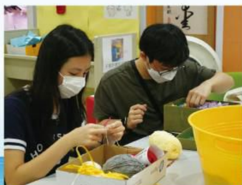
青年小組「一孖一」組員第一次主持青年市集分享，正！