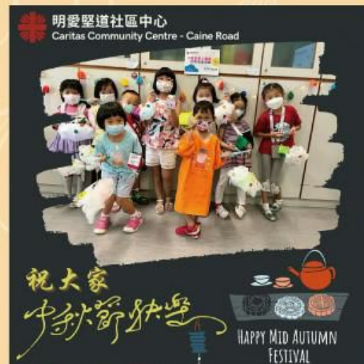
兒童會員小團圓活動花絮

備註：賽馬會「三房兩廳開檯食飯」社醫共生計劃由香港明愛及醫護行者兩間非牟利機構攜手合作，並獲香港賽馬會撥款推行。計劃服務港島中、西及南區劏房住戶，在地區提供延伸生活空間，非只支援經濟，更是促進住戶的社會系統改變。社醫共生在港是一個新概念，讓我們重新反思生活與健康之間的關係，並留意環境及生活條件所限而引致的健康差異。另外，社醫共生希望能作為一個跨專業溝通平台，集結社區及醫護智慧以提昇全民健康為目標，以人為本構建人人健康的社會。想知更多，請聯絡中心社工。