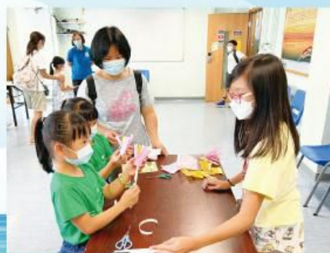
兒童義工攤位服務3，小義工正悉心分享環保花製作，醒！