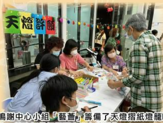
鳴謝中心小組「藝薈」籌備了天燈摺紙燈籠DIY攤位，當晚部份組員更出席主持攤位。