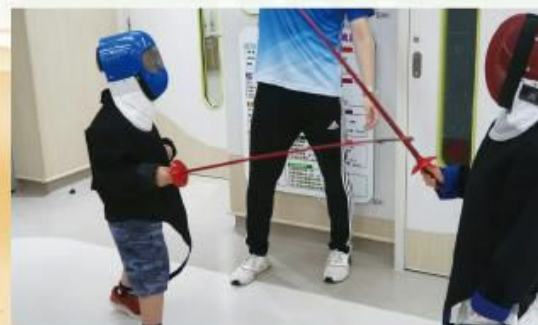
『劍擊試玩』：小心，看，我要出擊啦。