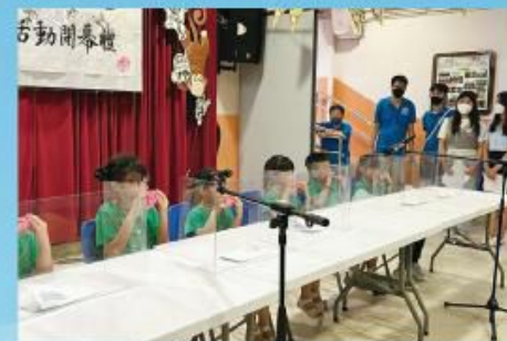
小朋友在舞台上用心為大家以陶笛吹奏《快樂頌》，動聽。