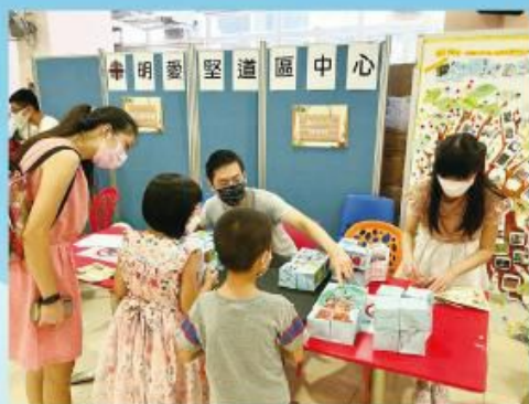
兒童義工攤位服務1，善用趣味的扭計骰作分享教材，妙！