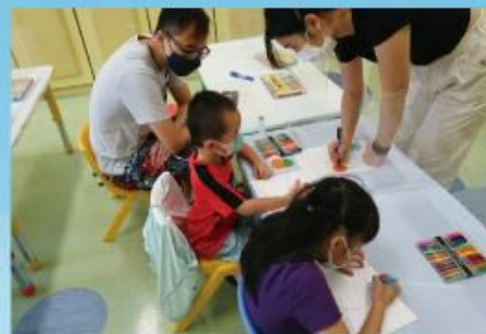
看，創意繪畫試玩讓小朋友有興趣地學習！