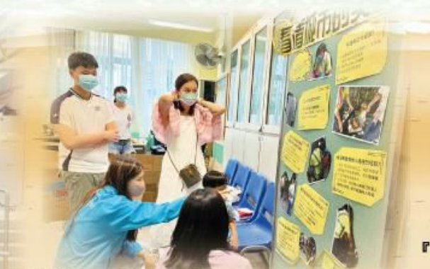
關愛清潔工友服務的義工及社工。