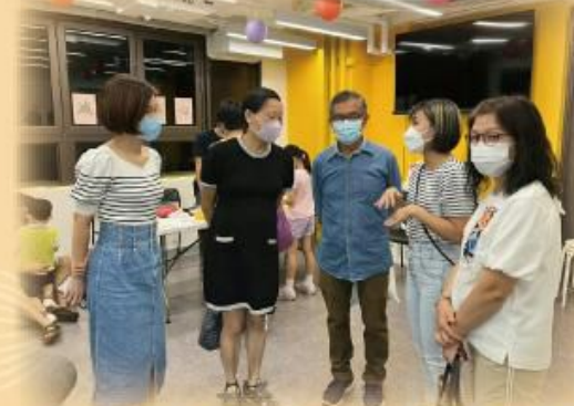
中心諮詢委員與街坊一起迎月同時參觀「三房兩廳」設施